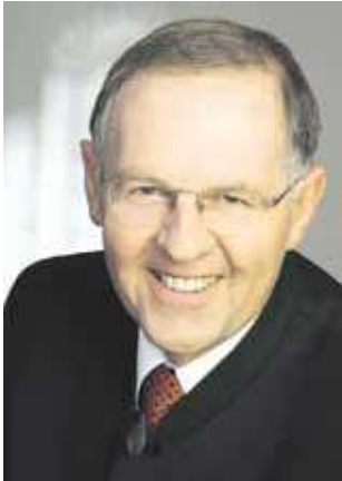
Ök.-Rat Gerhard Wlodkowski Präsident der Landwirtschaftskammer