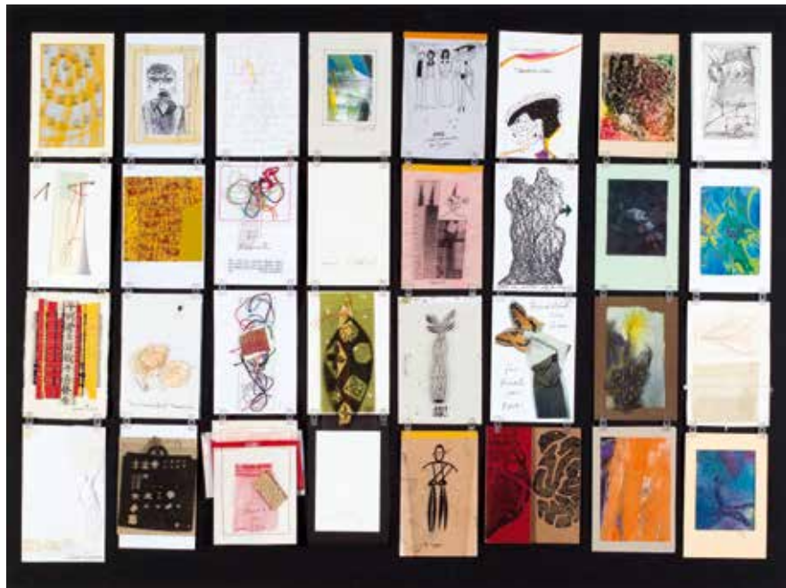
„Network – Art cut“ (Detail) 2016, Größe: 70 x 100 cm, 4-teilig Eigene Technik

Weitere Werke befinden sich im öffentlichen Besitz des In- und Auslandes u. a. Staatliche Kunstsammlungen Dresden, Museum für Kunsthandwerk Schloss Pillnitz, Savaria Museum Szombathely, Textilkunstsammlung Chieri, Italien, Museum für angewandte Kunst Wien, Universalmuseum Joanneum Graz.