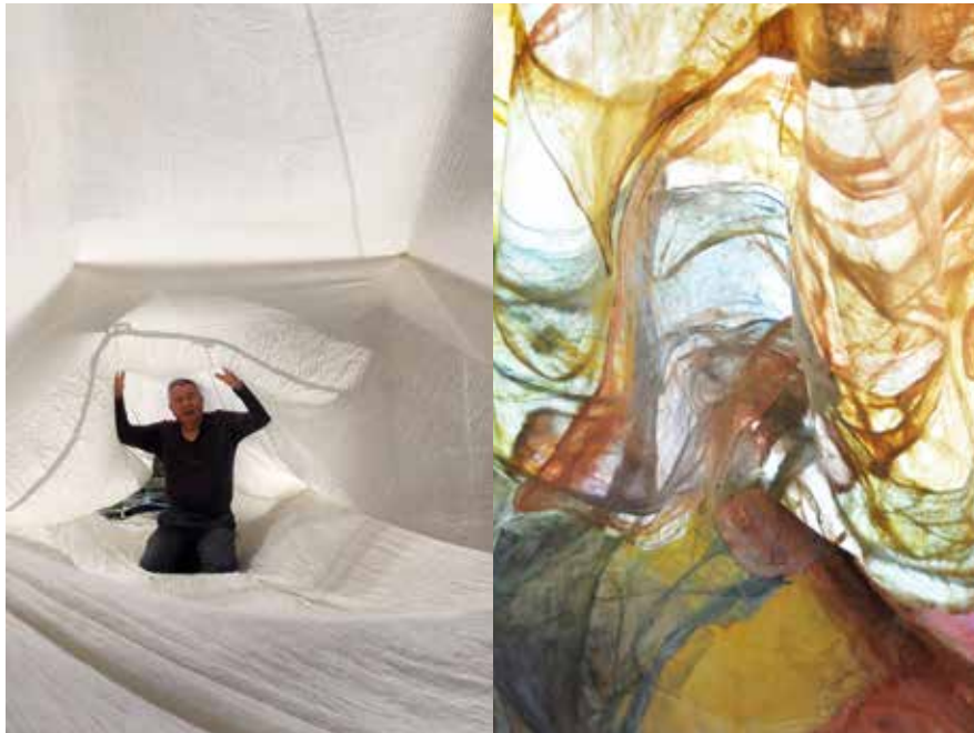
„Fork in the tube“ 2016, 12 x 10 m Methode: Handwebte, Material: Seide